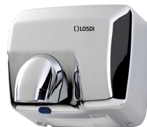
REF: CS-500-I/X Finition ACIER INOX. BRILLANT