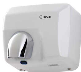
REF: CS-500-X Finition MÉTAL LAQUÉ BLANC