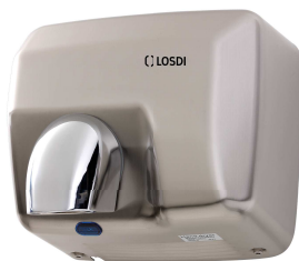
REF: CS-500-S/X Finition ACIER INOX. BROSSÉ