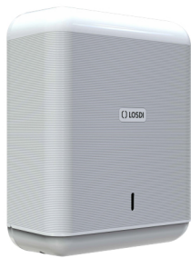
REF: CP-3009-B Finition BLANC