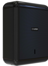
REF: CP-3009-BL Finition NOIR