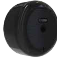
REF: CP-3000-BL Colour NOIR