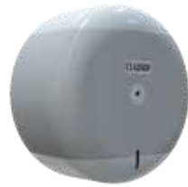
REF: CP-3000-B Colour BLANC