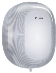
REF: CP-5011-B Couleur: BLANC