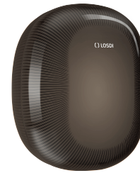
REF: CP-5011-BL Couleur: NOIR