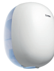
REF: CP-6110-B Couleur: BLANC