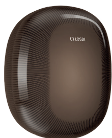
REF: CP-6010-BL Couleur: NOIR