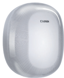
REF: CP-6010-B Couleur: BLANC